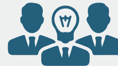
인성 / 리더십