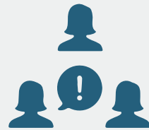
조직 내 역할